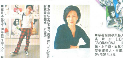
當地在日本指定了15年的紀念，視圖地為日本第一座國家。