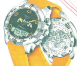
■備有防水深度100米天賦表「少女峰T-Touch II」 $7,700