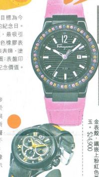
■Salvatore Ferragamo 多媒體打造個人腕錶 $22,000