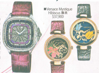
■Versace Mystique Hibiscus 腕錶 $37,900