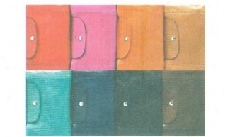
■備有多色選擇Le Pliage® Cuir 羊皮摺疊包 $1,980至6,050